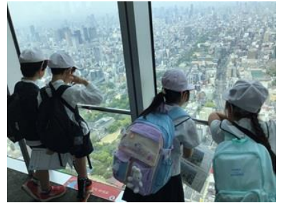
3・4年 天王寺動物園 あべのハルカス