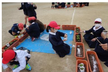
はな 花いっぱいプロジェクト@12月