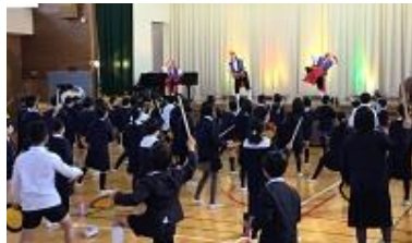
こうくじんけん つど たいけん 校区人権の集い (エイサー体験)