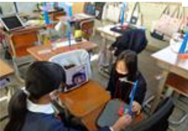
たんげんないじゅうしんどがくしゅう ねんりか 単元内自由進度学習 5年理科