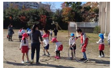
むかしあそび あきあそび ちいき ねん ねん 昔遊び・秋遊び (地域・1年・2年・あおぞら幼)