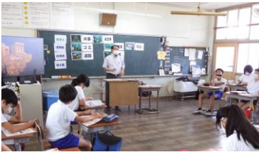
そせいきょうしつ ねん 租税教室 6年

さて、明日から子どもたちが心待ちにしていた冬休みです。年末年始は、日本の伝統文化を一年で最も感じることができる時期と言えます。子どもたちには、他の休みとは違う特別な感覚を味わいながら、充実した冬休みを過ごしてほしいと思ひます。