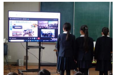
いちおうちゅうがっこうなかよ こうかん 一丘中学校区仲良し交歓サミット