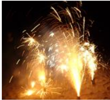
はなび ミステリーツアー（ゴーグルをつけてみんなで花火）