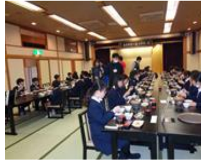
あさごはん じぶん あつあつめだまや 朝御飯(自分で熱々目玉焼き)