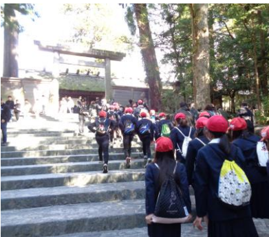
いせじんぐうけんがく 伊勢神宮見学

この二日間の思い出や経験が、卒業までのクラスでの時間をより豊かにしてくれることを願っています。