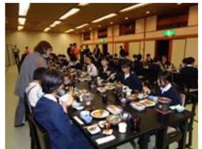
ごうか ばんごはん なか 豪華な晩御飯でお腹いっぱい