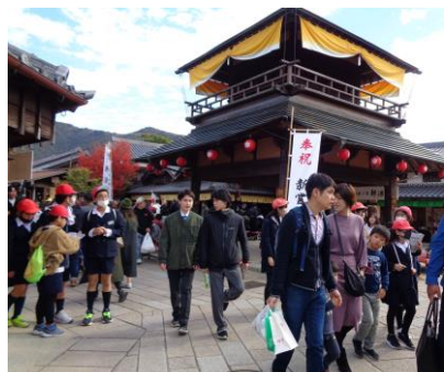
よこちょうさんさく おかげ横丁散策