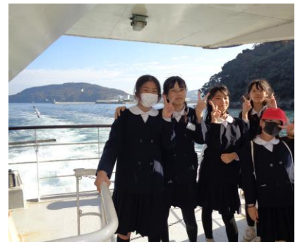
とばわん 鳥羽湾クルーズ